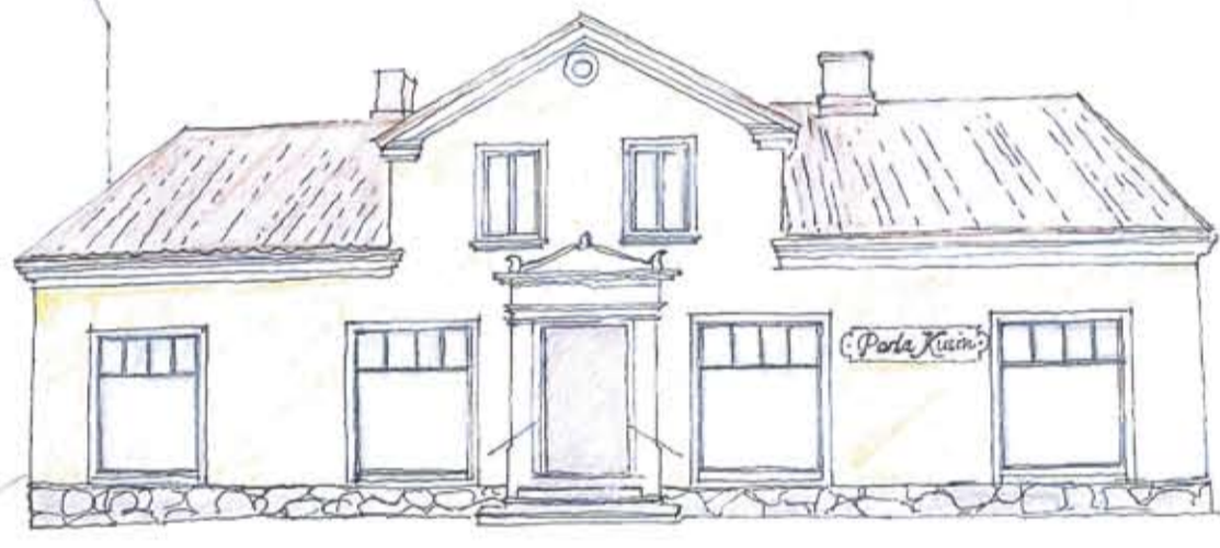
Fasad mot Kyrkogatan

Tillhör byggnadsinspektörens beslut av 2008-02-19 betygar Selma Hammar Jämlikt Plan- och bygglagen (PBL) kap. 9 skall en omgång av byggnadsinspektören fastställda handlingar finnas tillgängliga på arbetsplatsen. Byggnadsinspektören i Skurups kommun