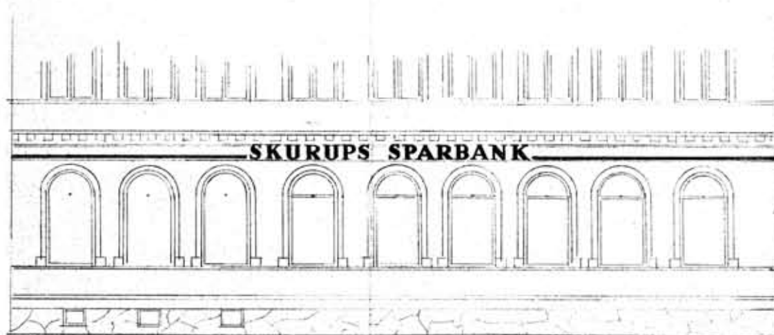
FASAD MOT VESTER