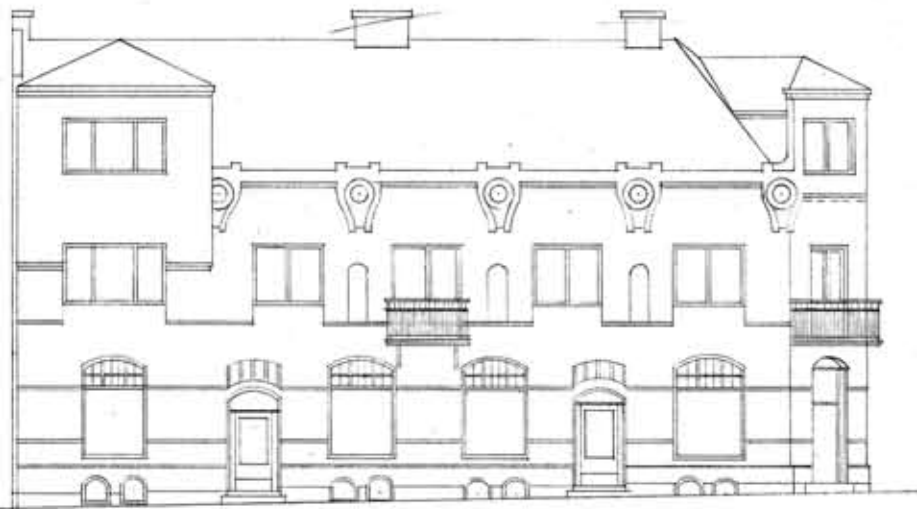
FASAD MOT STORA KYRKOGBATAN

FASADEN EFTER ÄNDRING 1951 KV. NR. 60 FREDRIK SKURUPS KÖPING